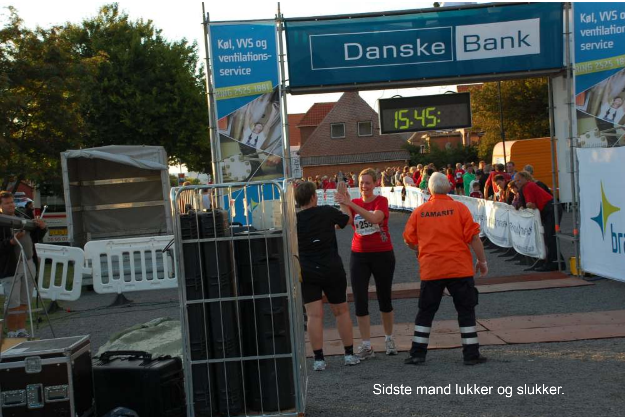
Sidste mand lukker og slukker.