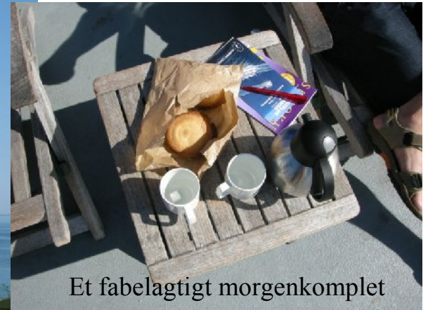
Et fabelagtigt morgenkomplet