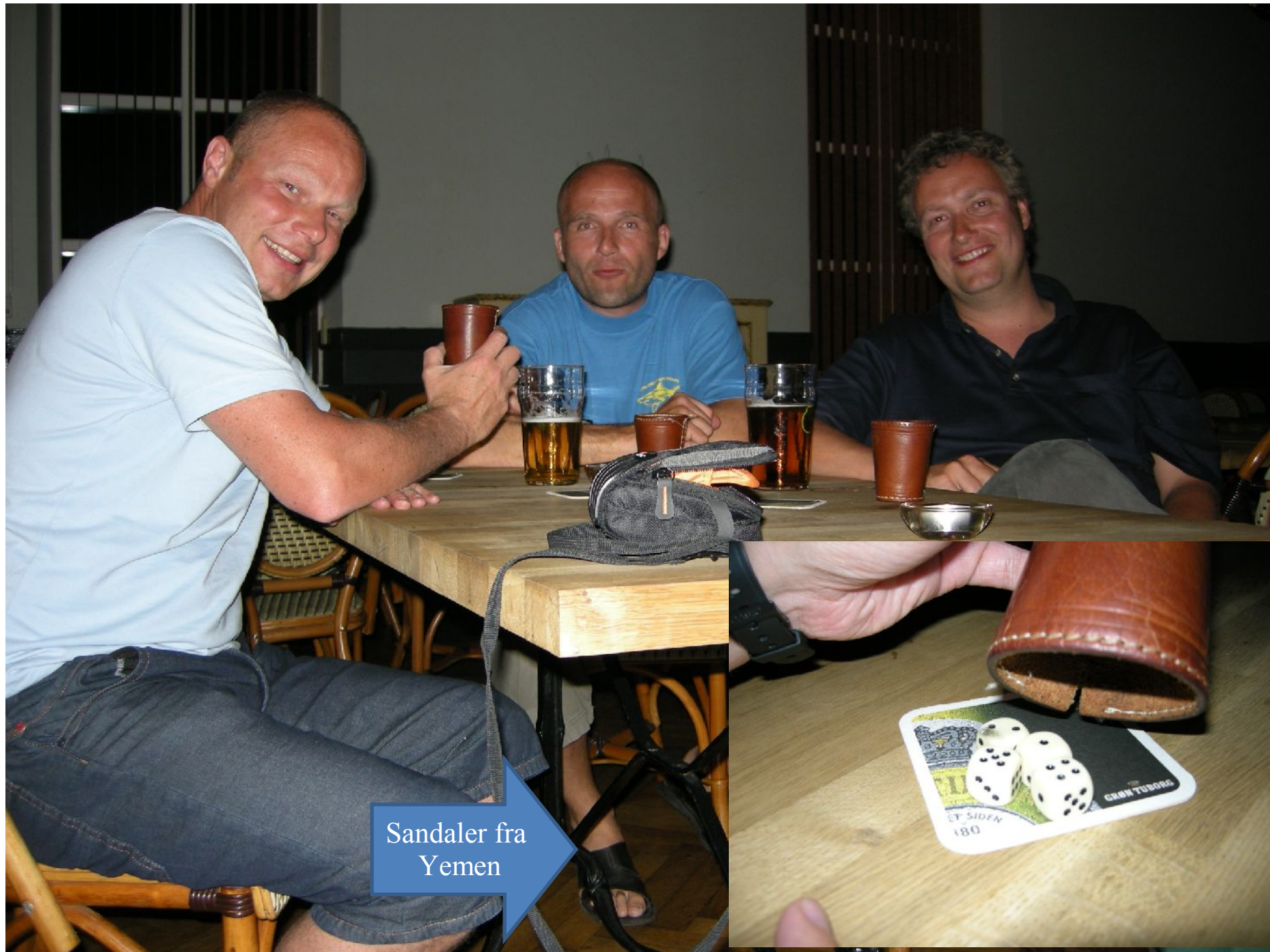
Sandaler fra Yemen