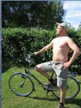
DERNY-paceren - også benævnt windbreakeren

- en cykeltræningslejr arrangeret og gennemført af Pinseudvalget juni 2005