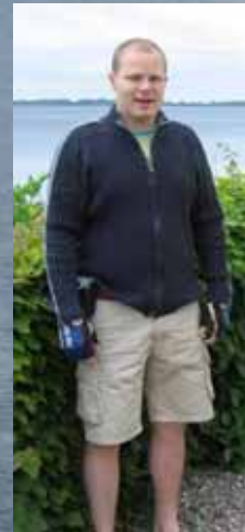
Den legendariske konceptmager havde atter med kendt entusiasme sammensat et velafstemt 4-dages program