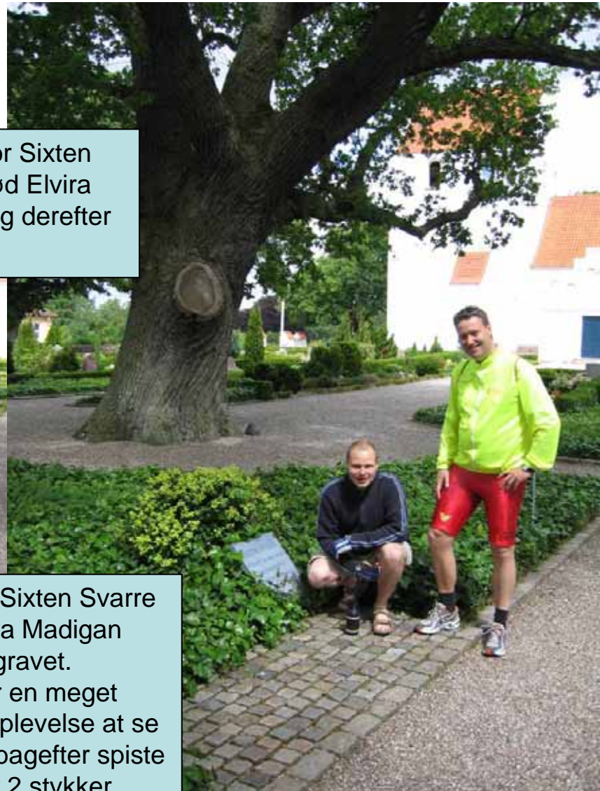
Her ligger Sixten Svarre og Elvira Madigan begravet. Det var en meget bevæget oplevelse at se gravene, - bagefter spiste vi hver 2 stykker wienerbrød