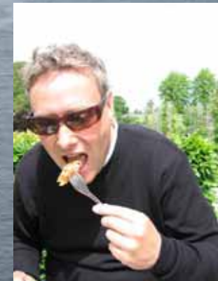
AGTERLANTERNEN Blev ikke på noget tidspunkt set i front - Men ellers gik han skam til den