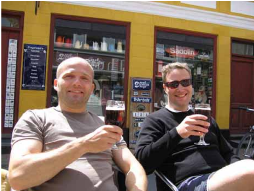
To tunge med to store... - Som hurtigt indtages mens de venter på deres MAXI burger

Over Siø til Langeland, hvor frokosten indtages i det idylliske Rudkøbing